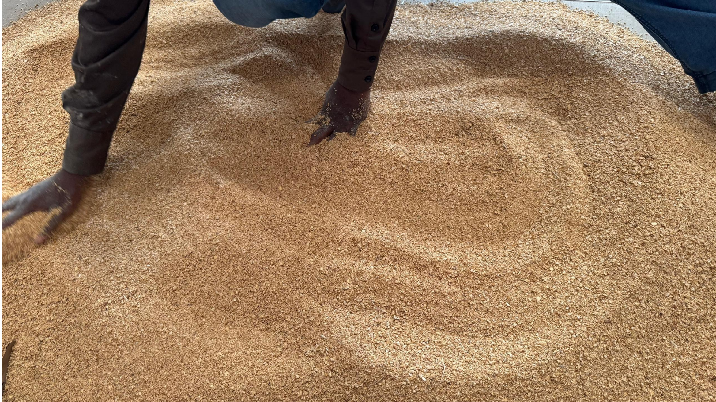
优质脱油豆粕 产地：贝宁