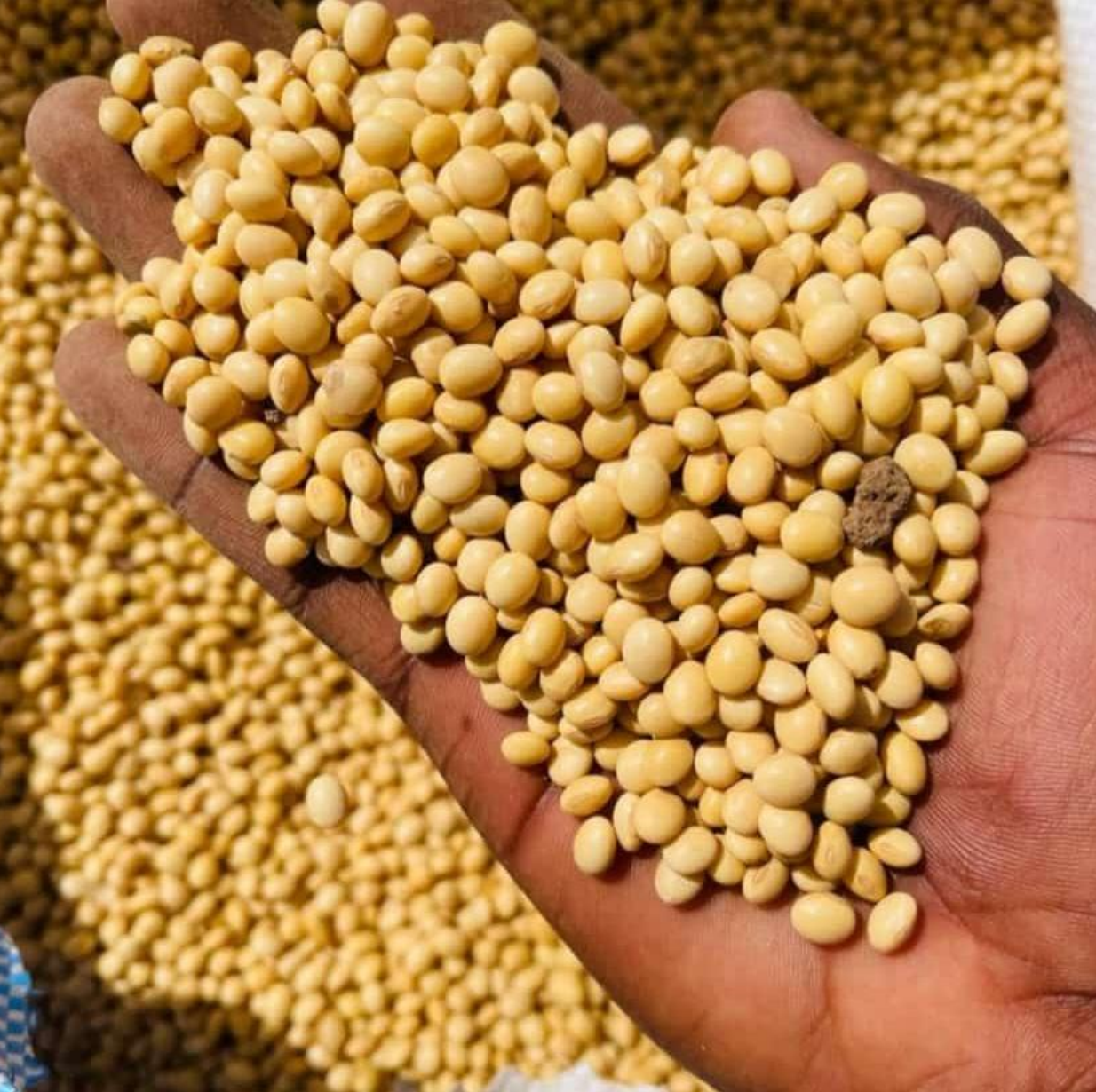
Soja sin limpiar