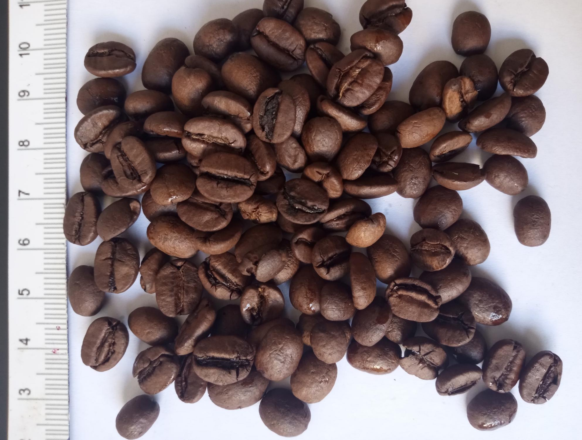
Café Arábica Brasileño Good Cup, tamiz 13/18, 77-82 puntos, tostado medio