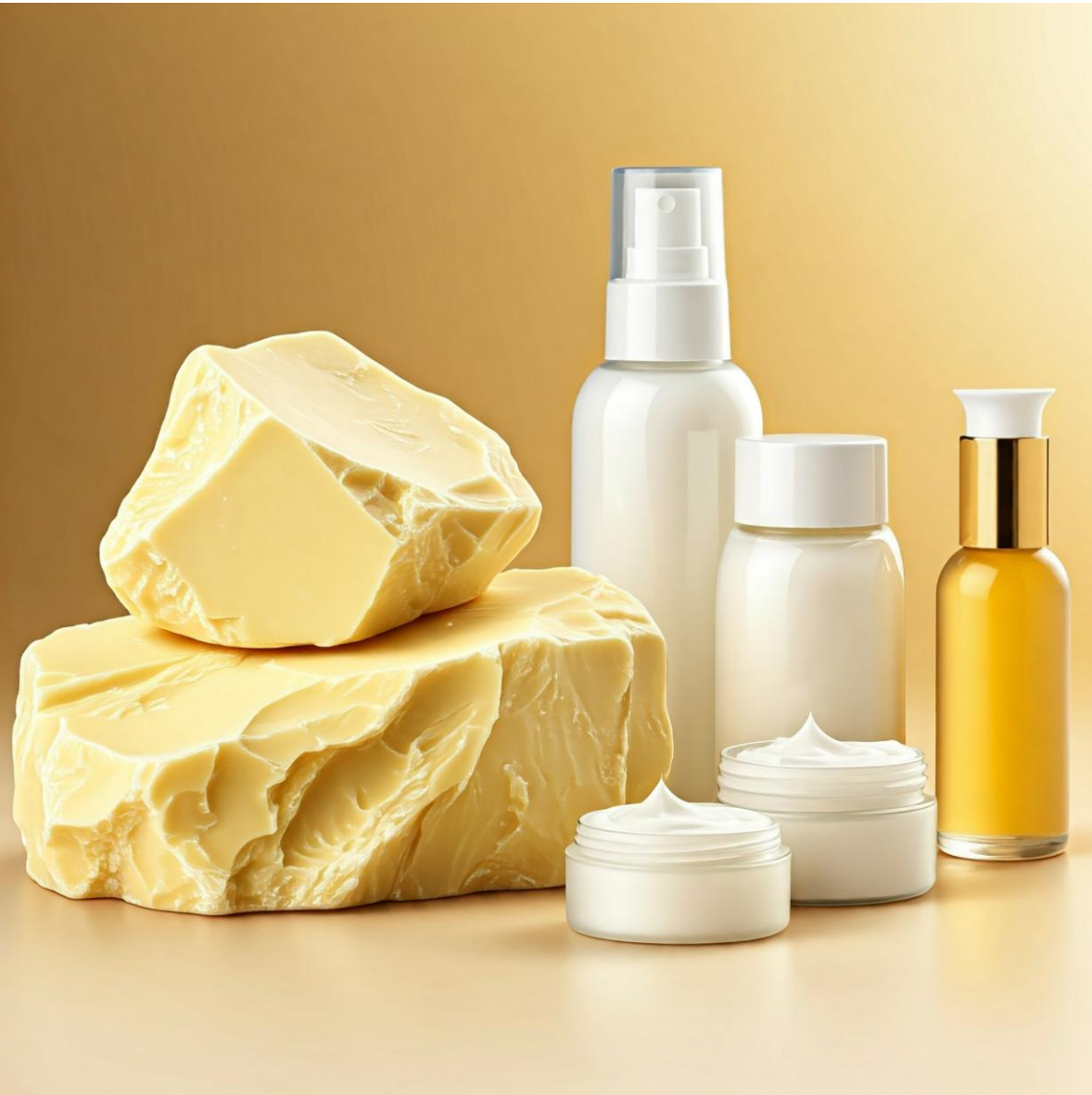
Feuchtigkeitscremes und Lotionen