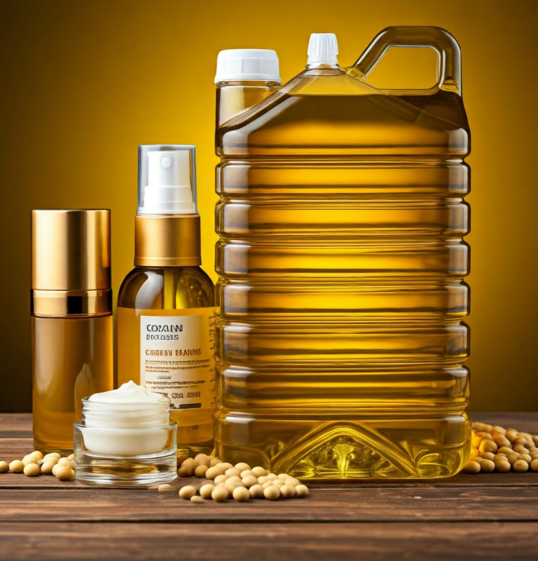
Produtos para a pele que usam óleo de soja bruto como ingrediente