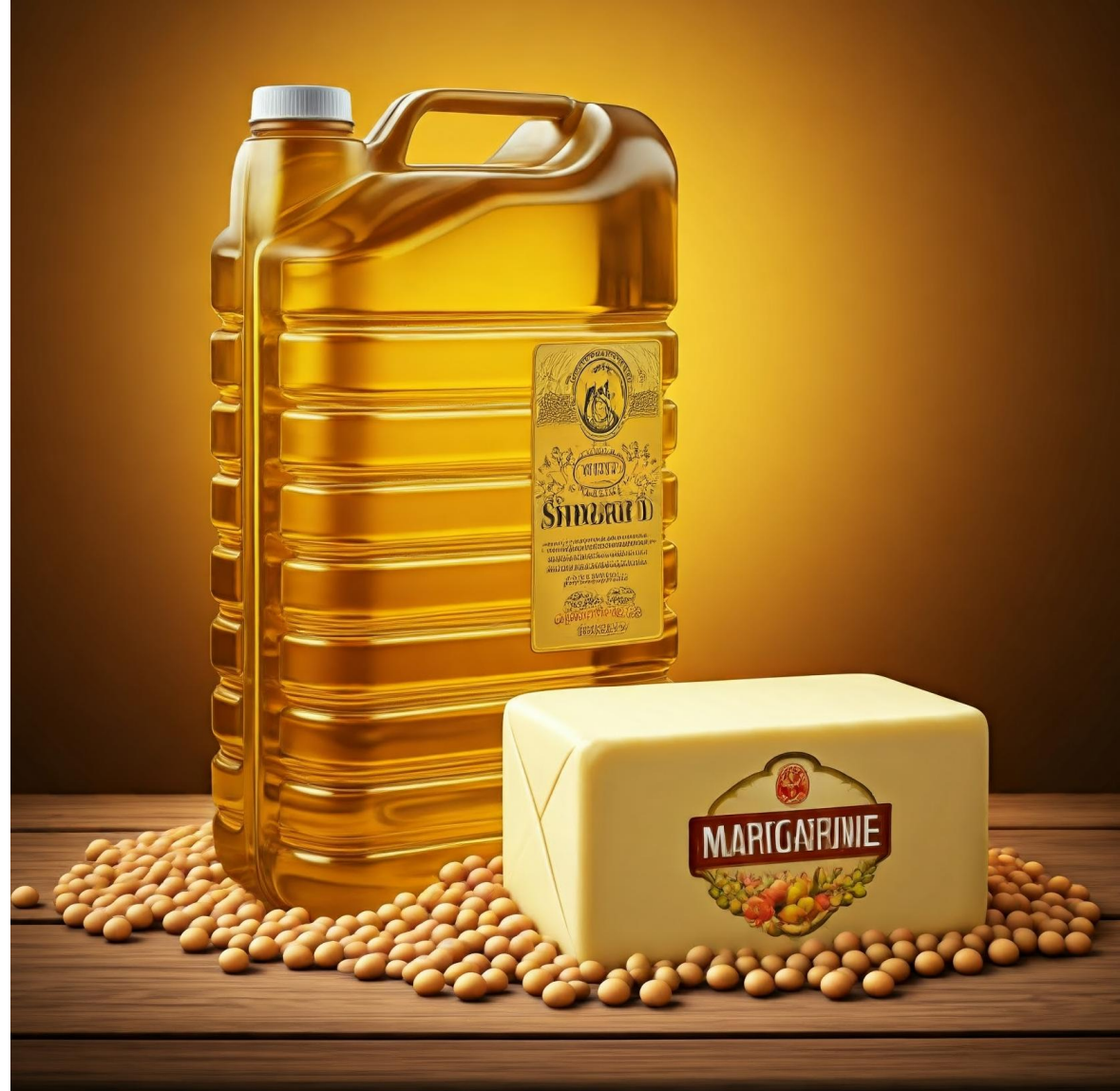
Margarina usando óleo de soja bruto como ingrediente