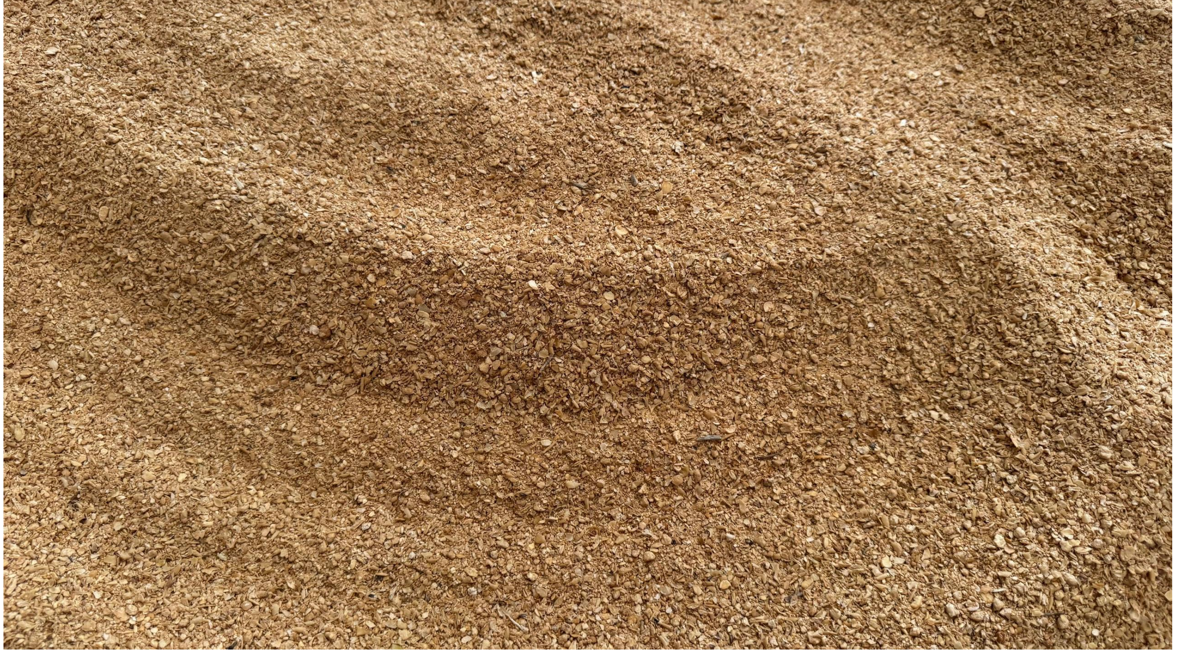
كعكة فول الصويا المنزوعة الزيت المميزة المنشأ: بنين