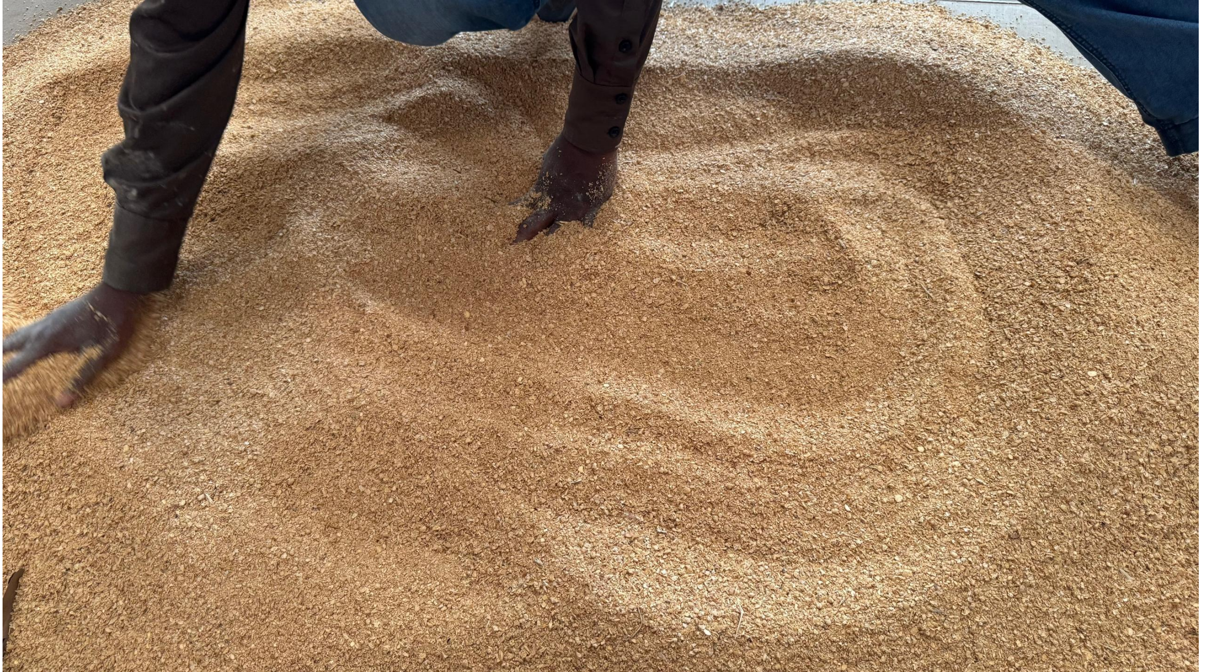
كعكة فول الصويا المنزوعة الزيت المميزة المنشأ: بنين