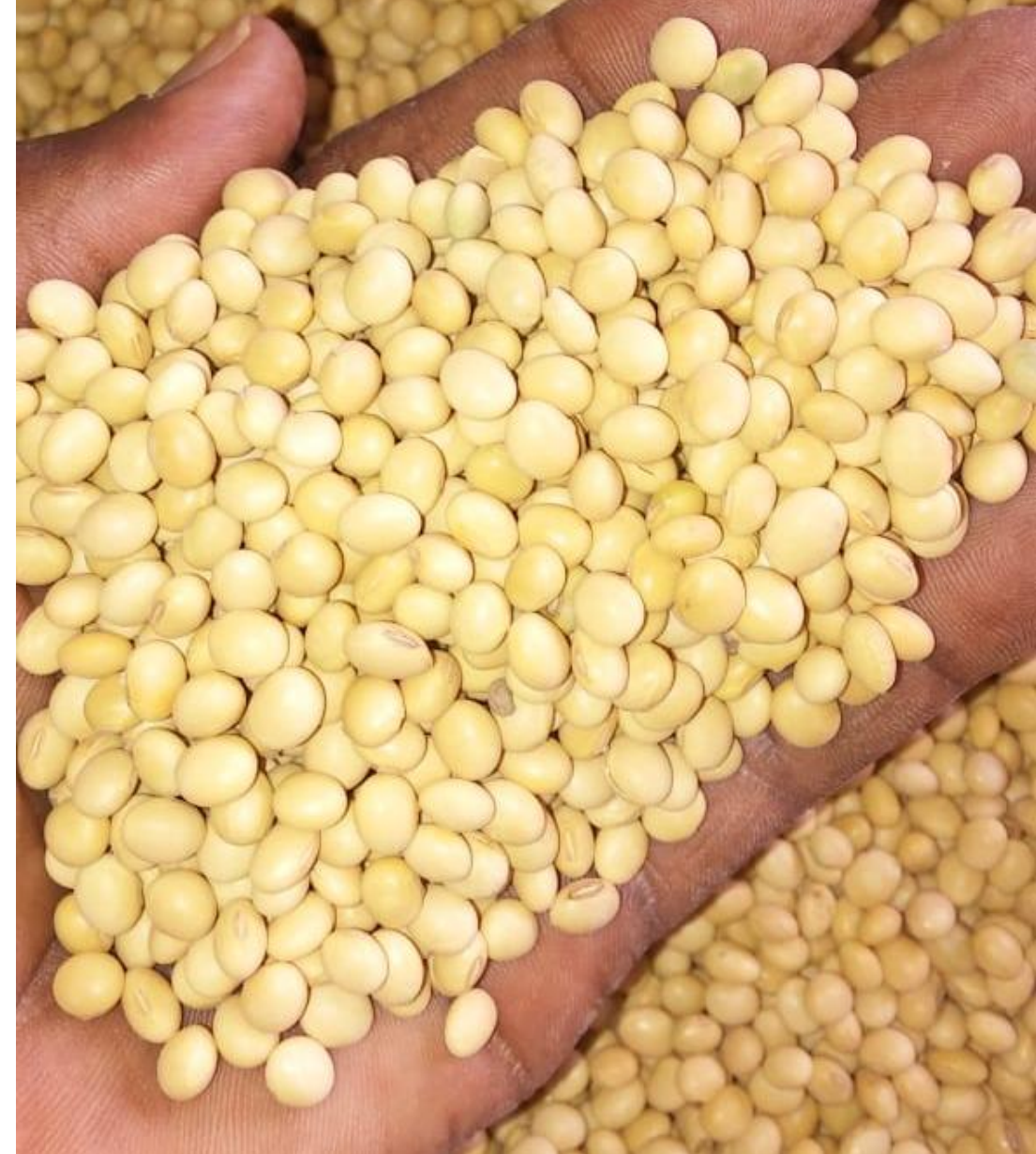
حبوب فول الصويا المنظفة