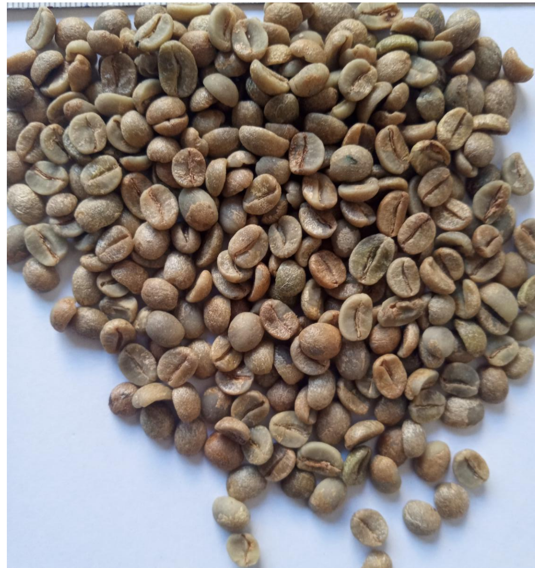
Kawa Arabica z Brazylii