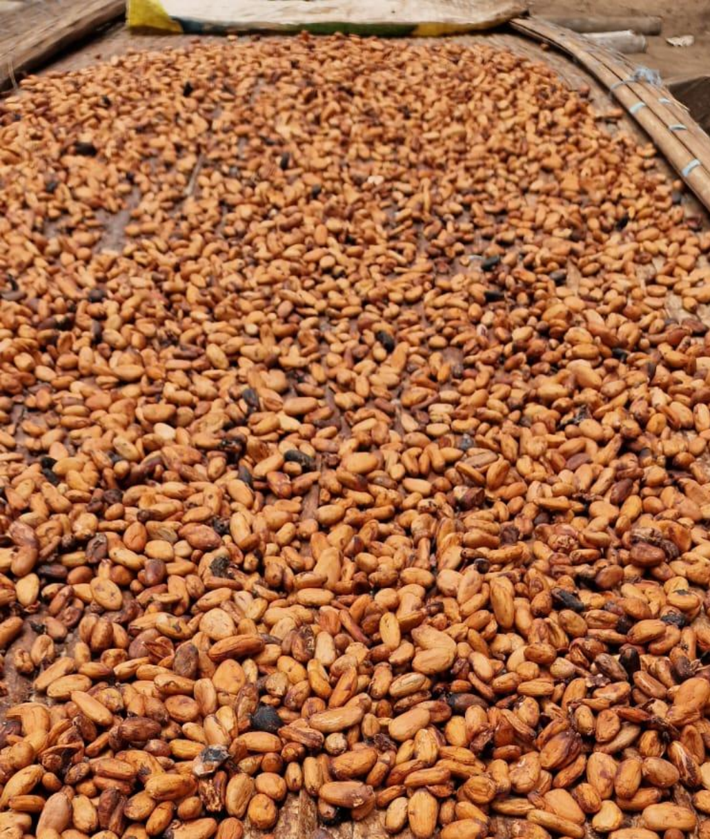
Suszone na Słońcu Ziarna Kakao (Wybrzeże Kości Słoniowej)