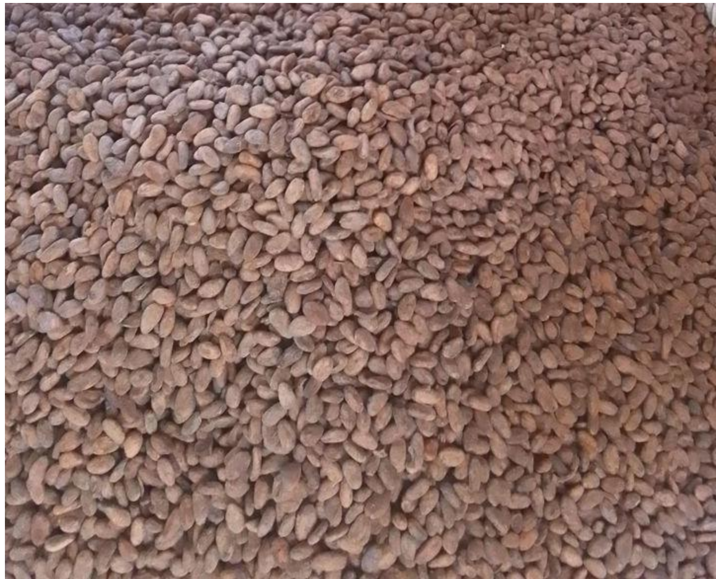
Suszone na Słońcu Ziarna Kakao (Nigeria)