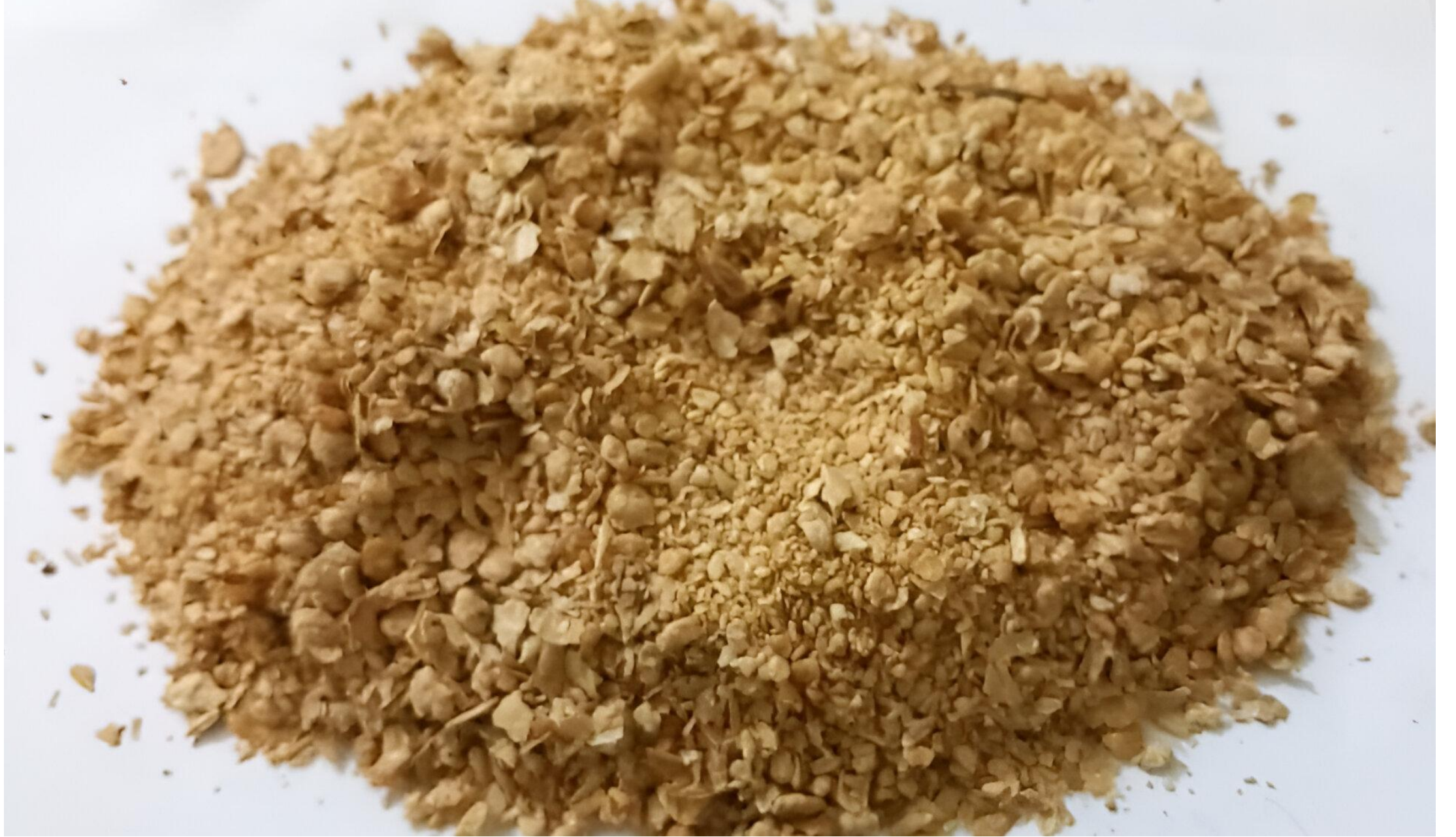
كعكة فول الصويا المنزوعة الزيت المميزة المنشأ: بنين