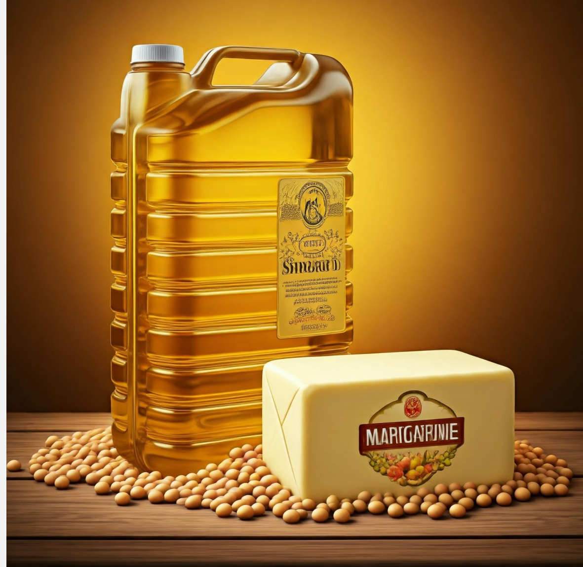
以大豆原油为原料的人造黄油