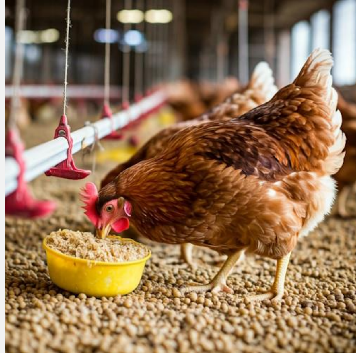
Nutrizione dei Polli con Torta di Soya Premium De-Oiled in una Moderna Fattoria al Coperto