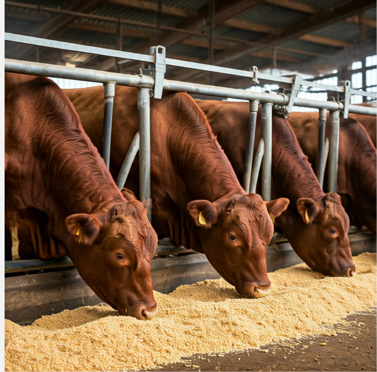
Nutrizione del Bestiame con Torta di Soya Premium De-Oiled in una Moderna Fattoria al Coperto