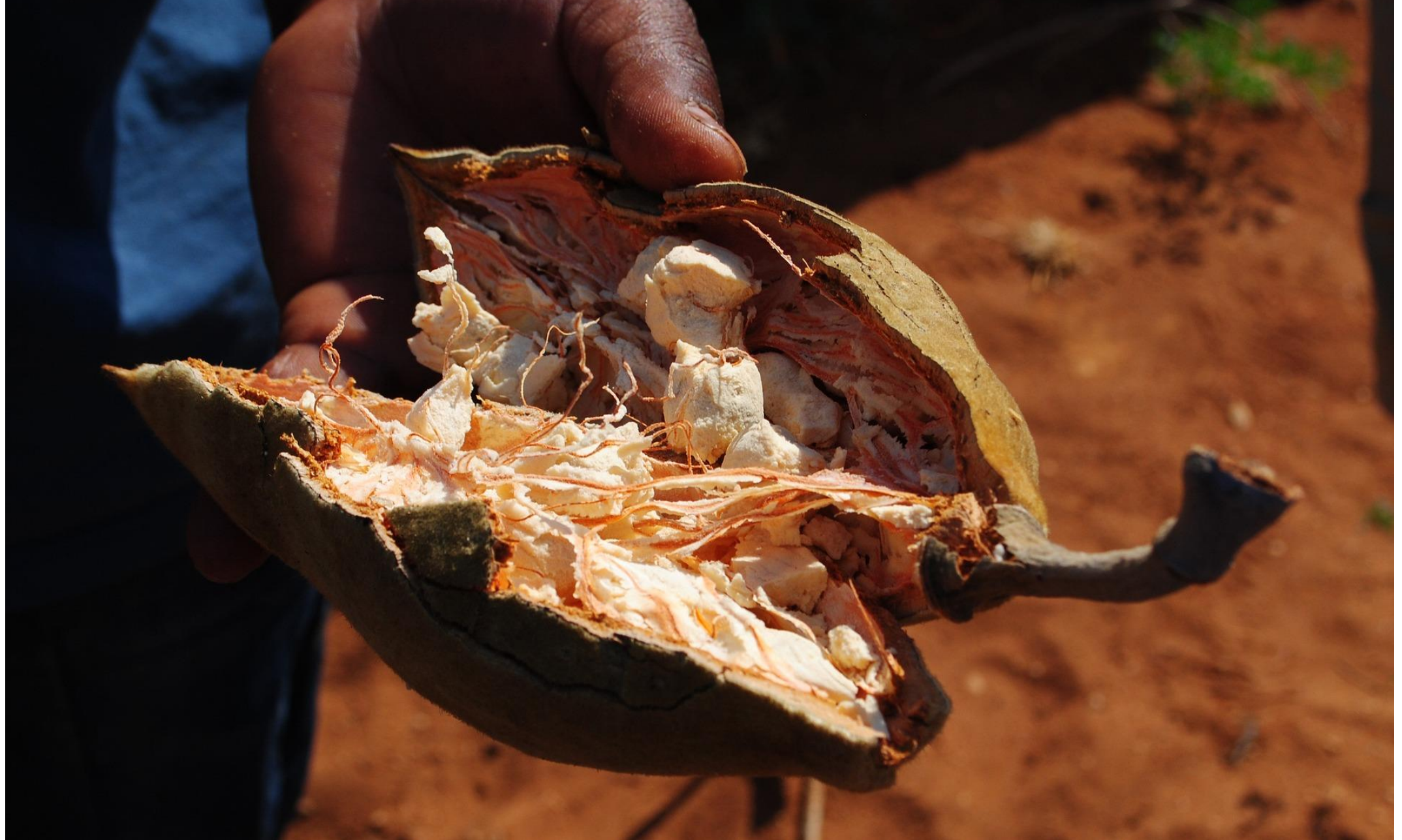
猴面包树（水果和果肉）