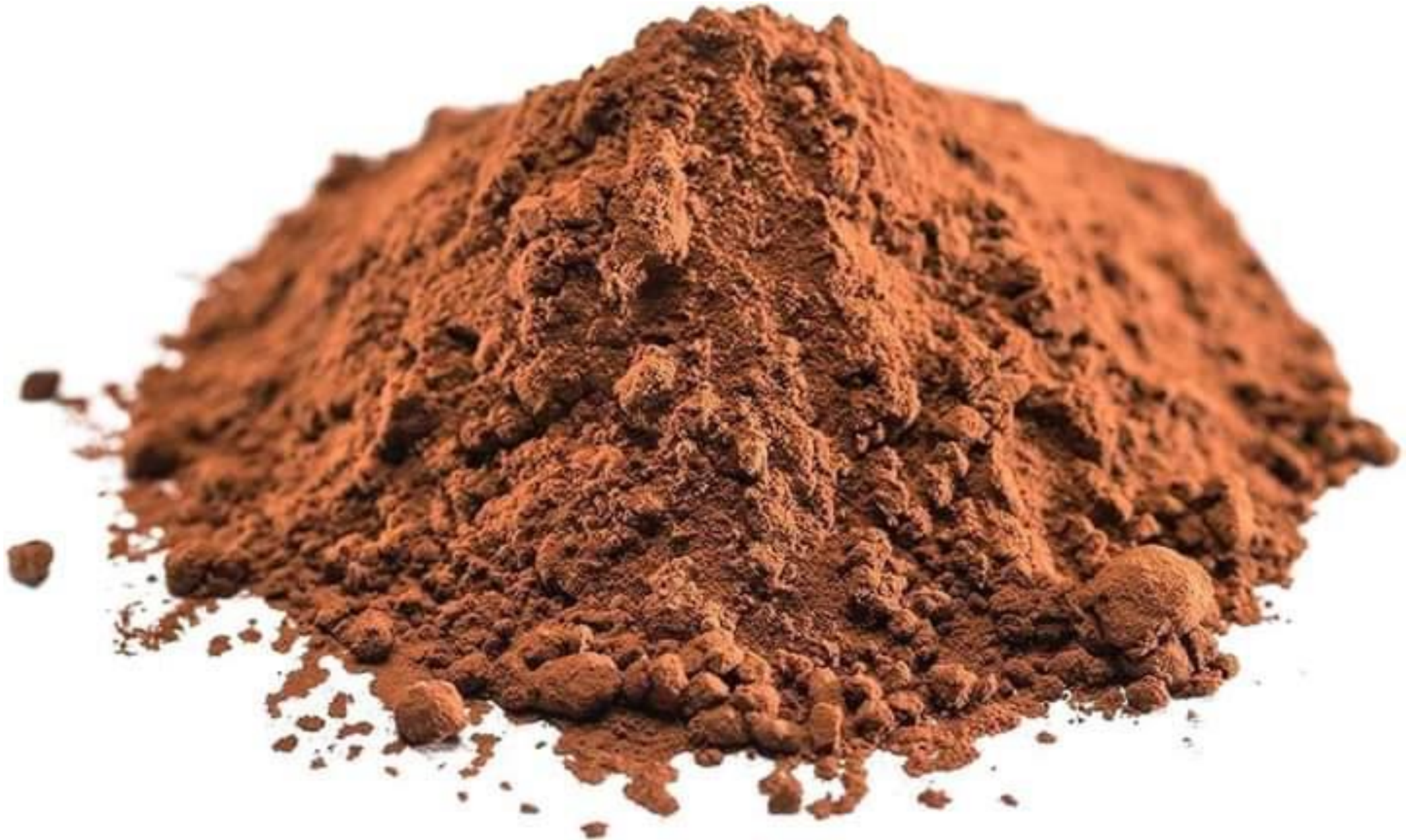
Cacao en polvo natural