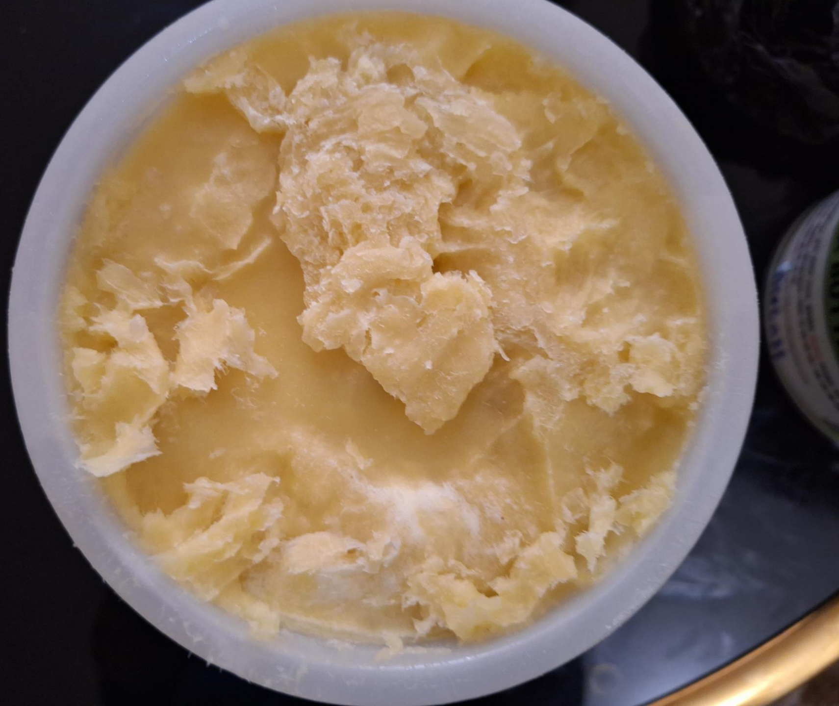
Manteca de karité