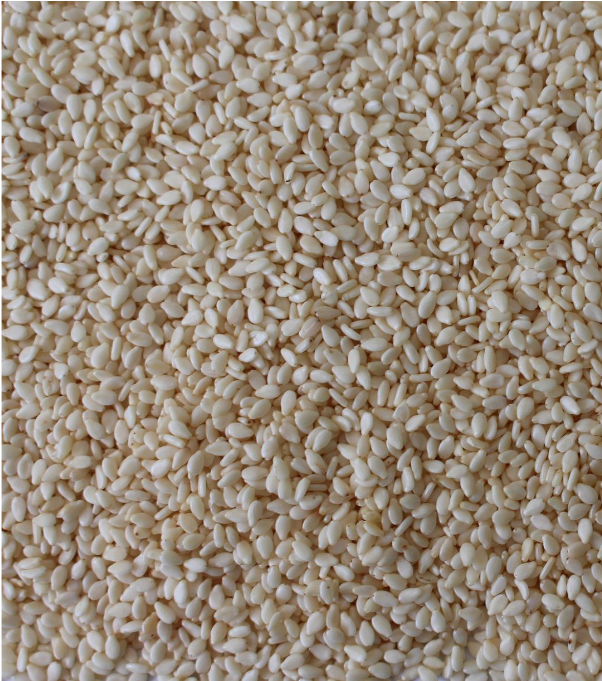
Semillas de sésamo blanco