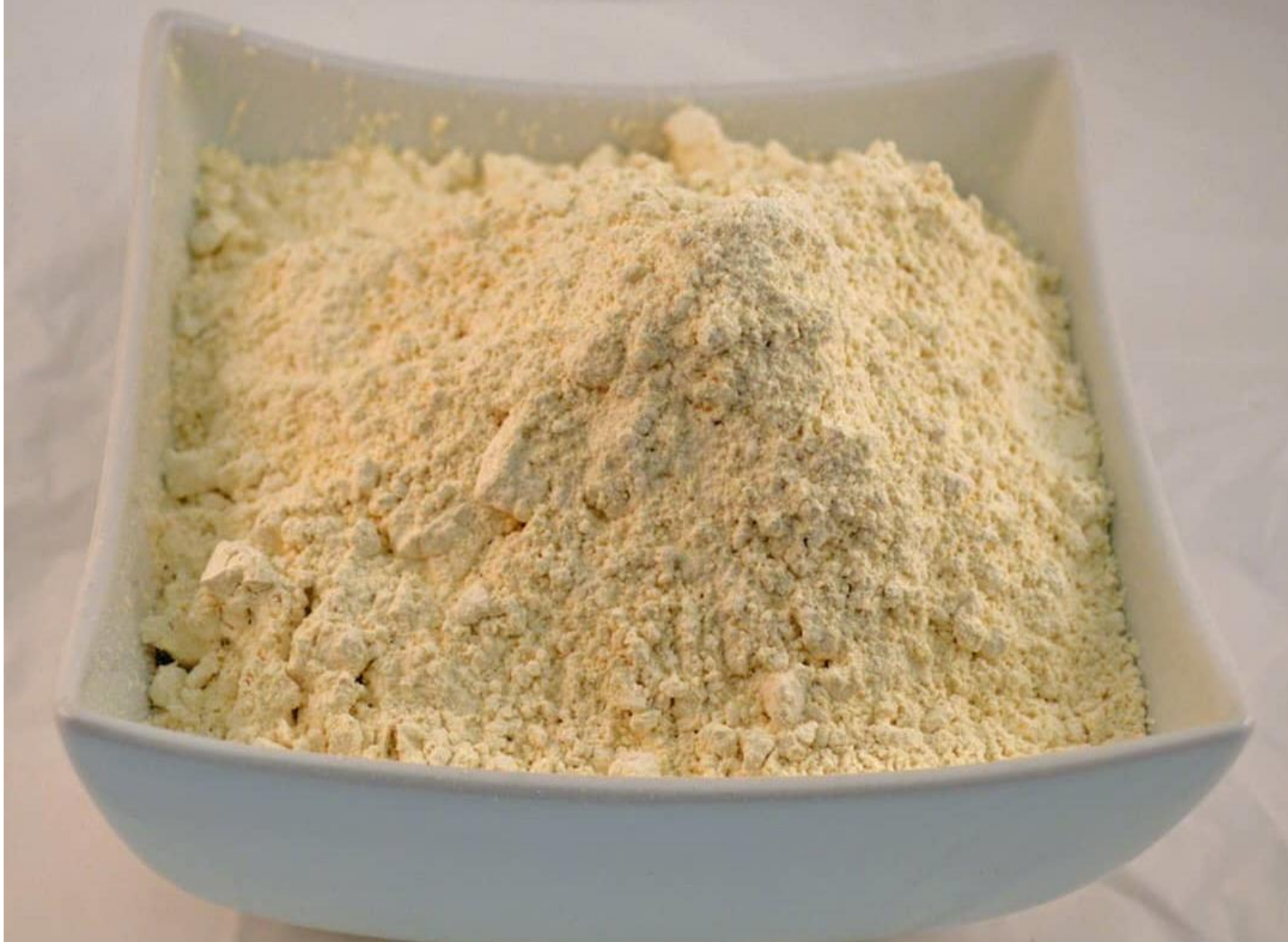
Harina de soja orgánica