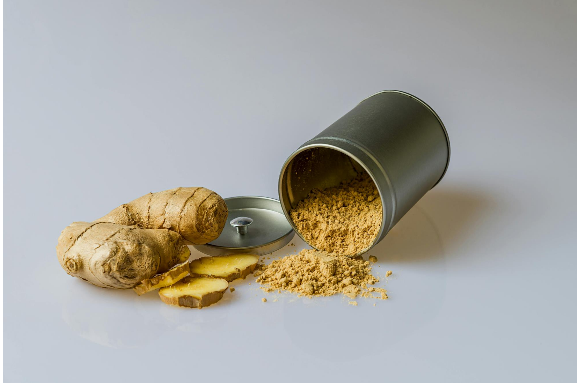
Jengibre en polvo