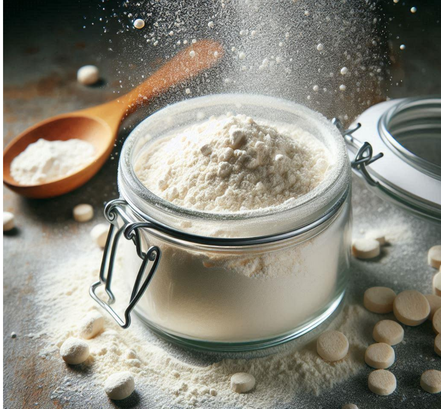
Harina de yuca