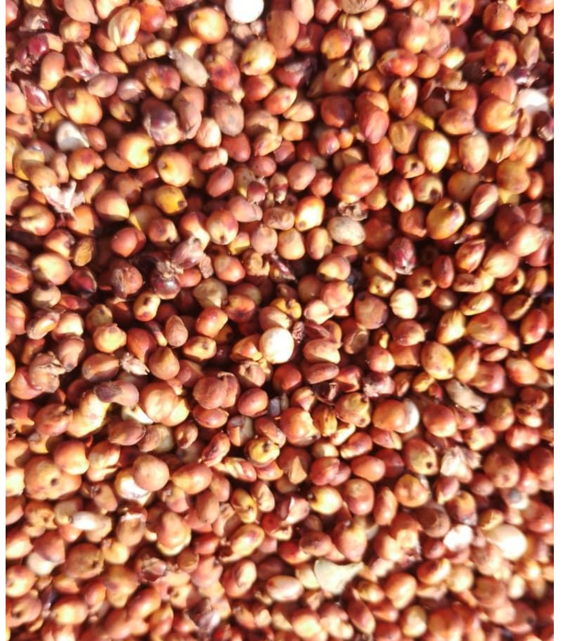
Granos de sorgo rojo