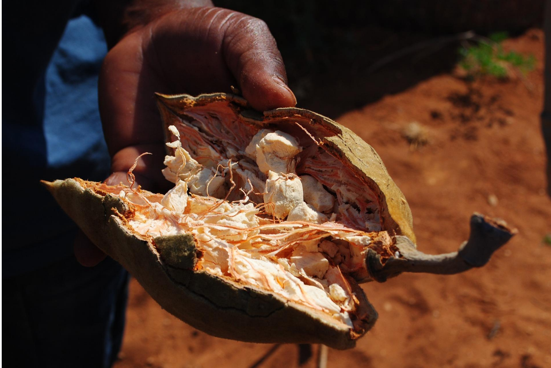
Baobab (fruta y pulpa)