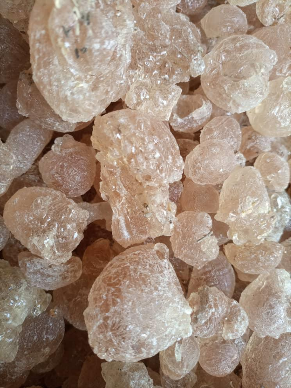
Grado de comida