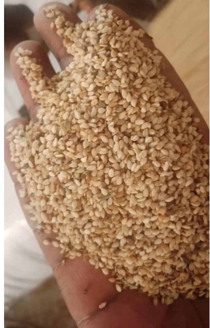
Semillas de sésamo variadas