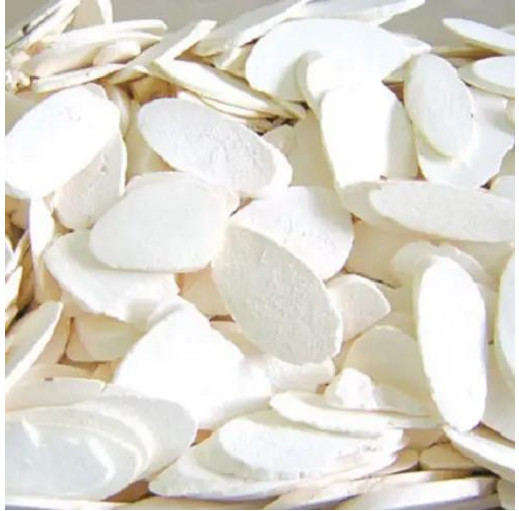
Chips de yuca secos