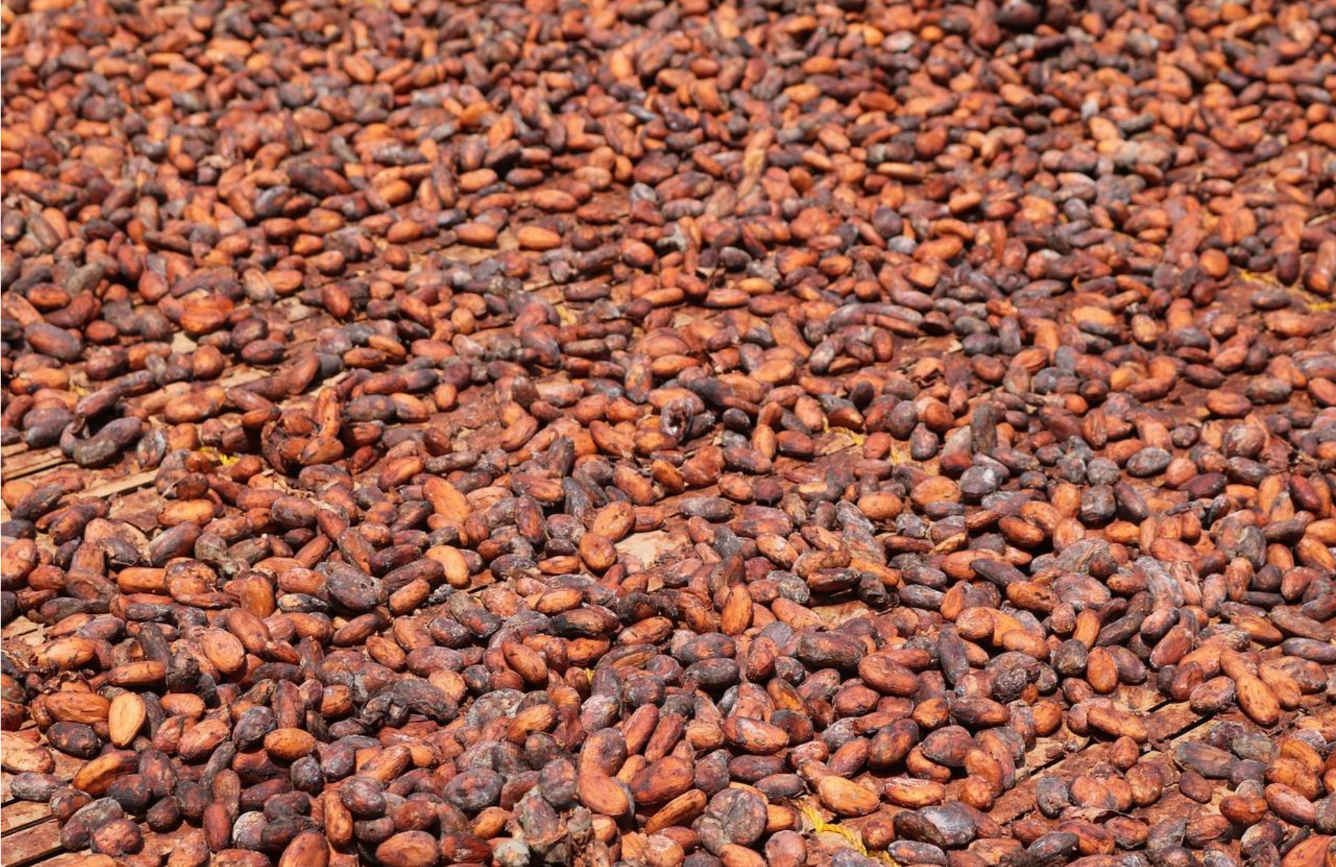
Grano de cacao fermentado secado naturalmente bajo el sol