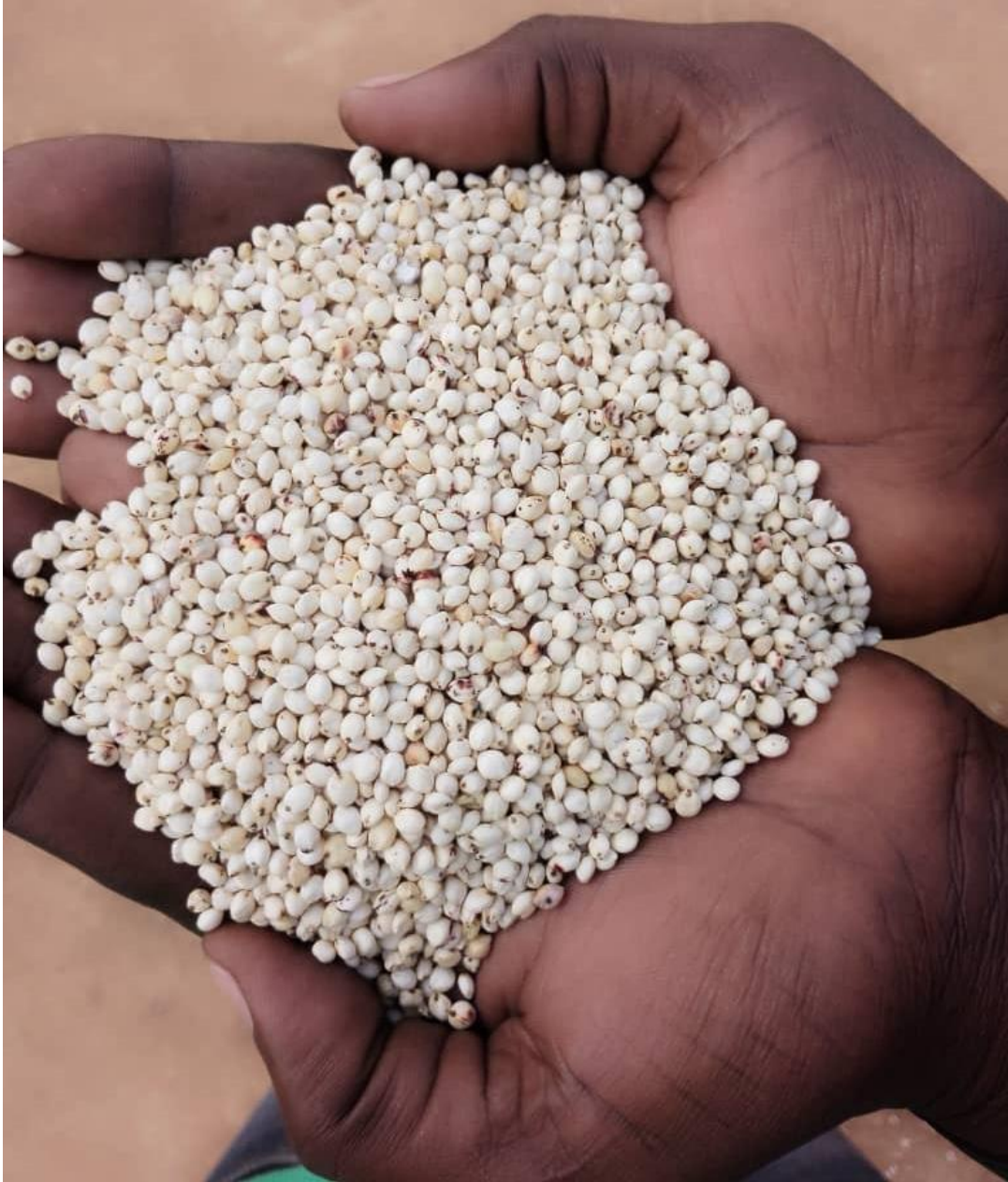
Granos de sorgo blanco