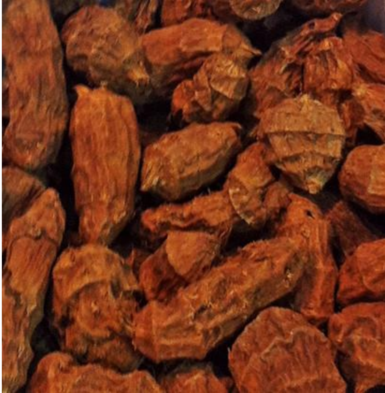
Chufas (guisantes dulces)