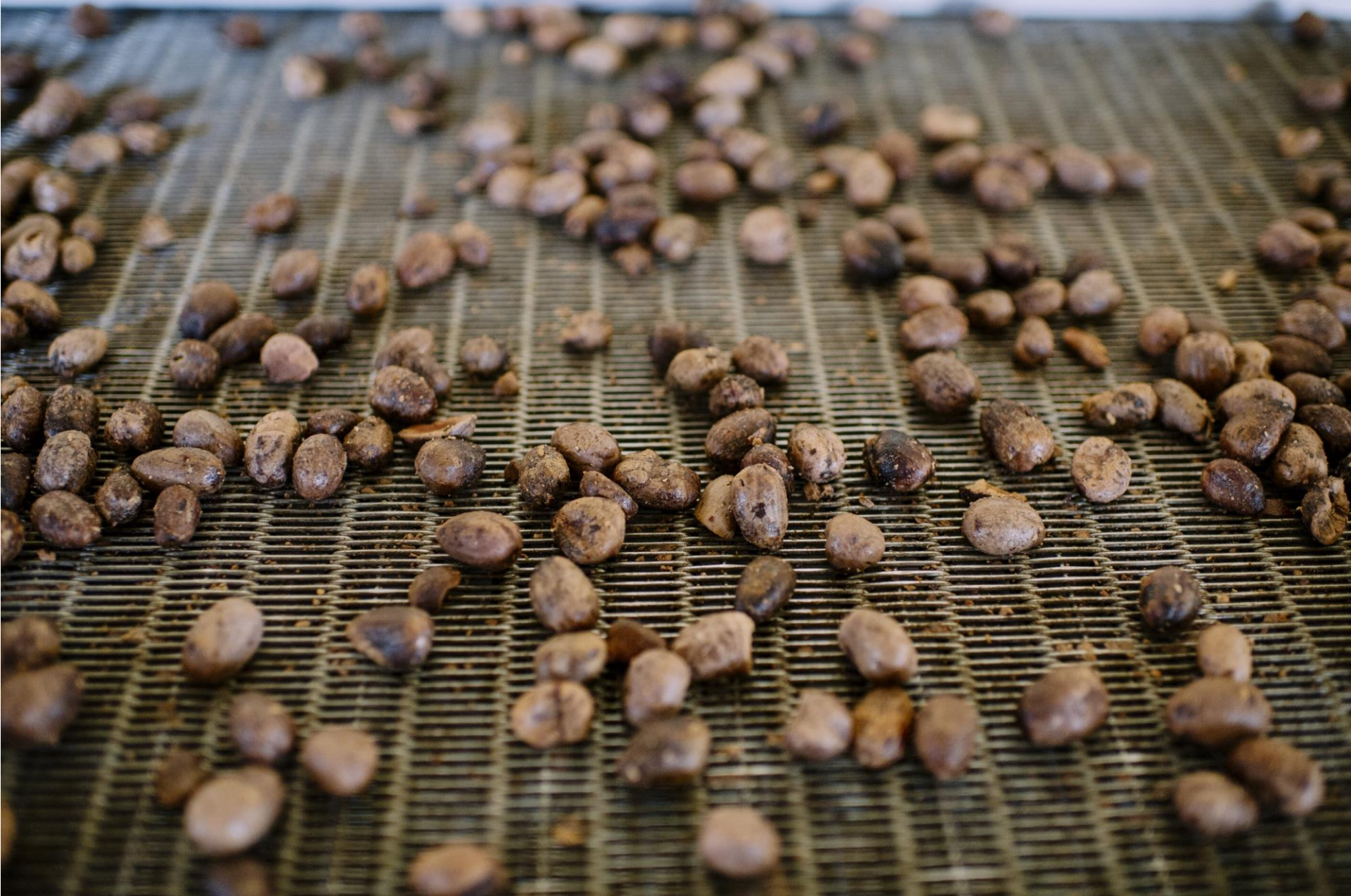
Nueces de karité