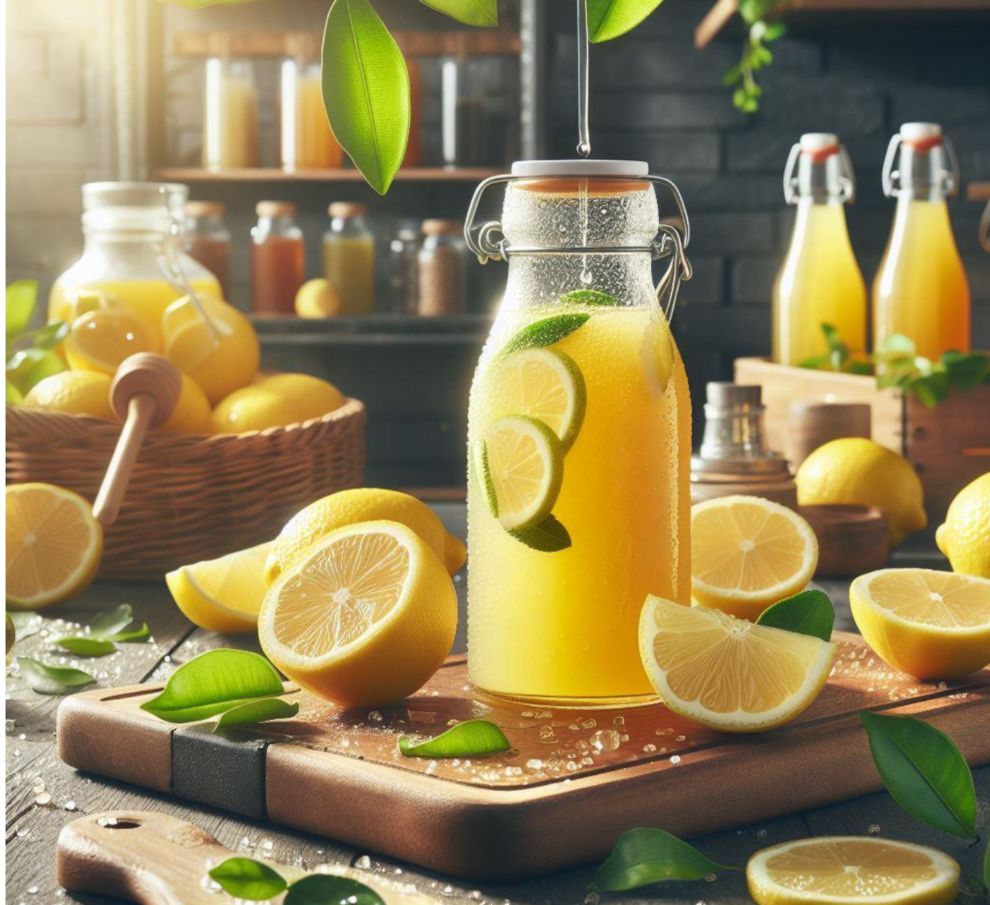
Jugo de limón 100% puro