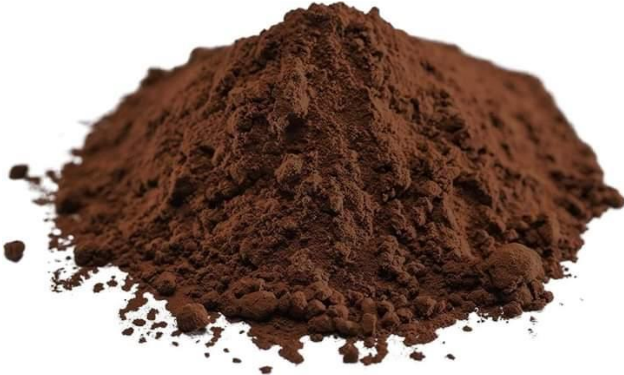
Cacao en polvo alcalinizado negro