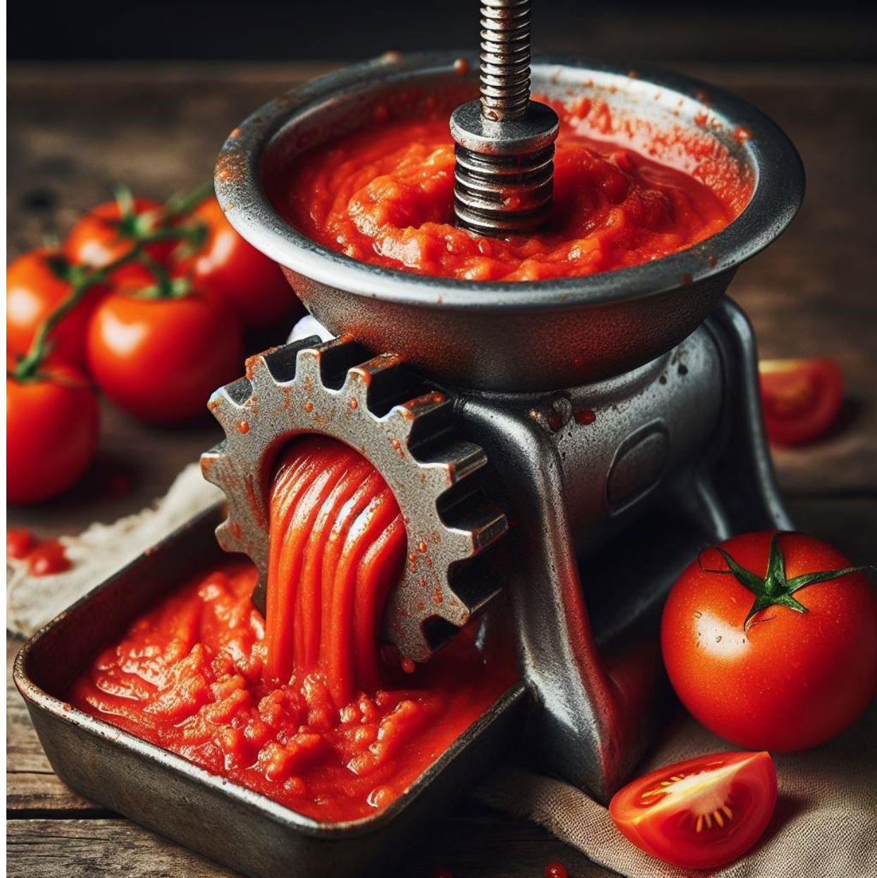
Puré de tomate Para productores de alimentos