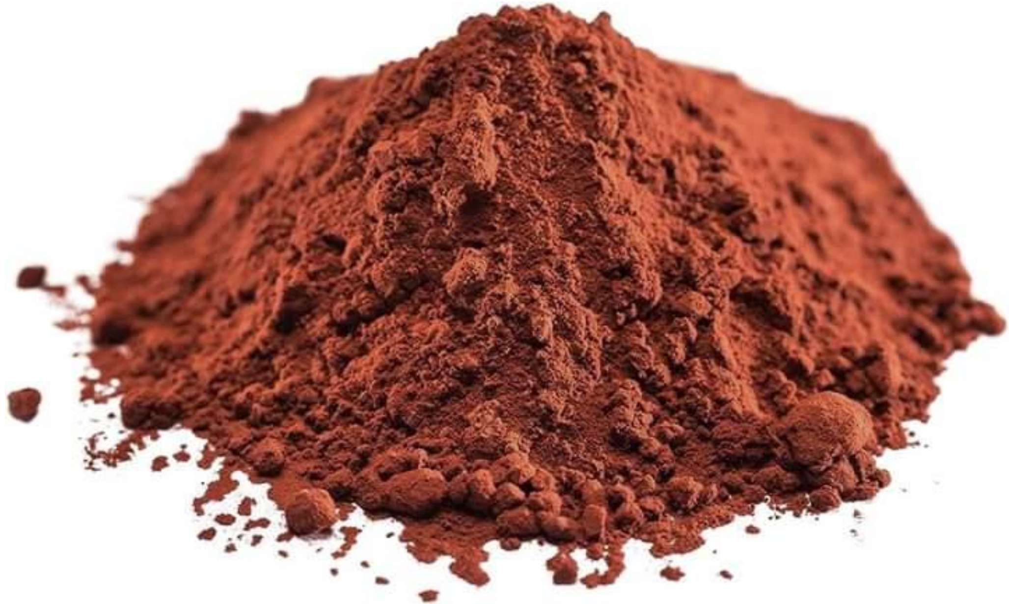
Cacao en polvo alcalinizado marrón