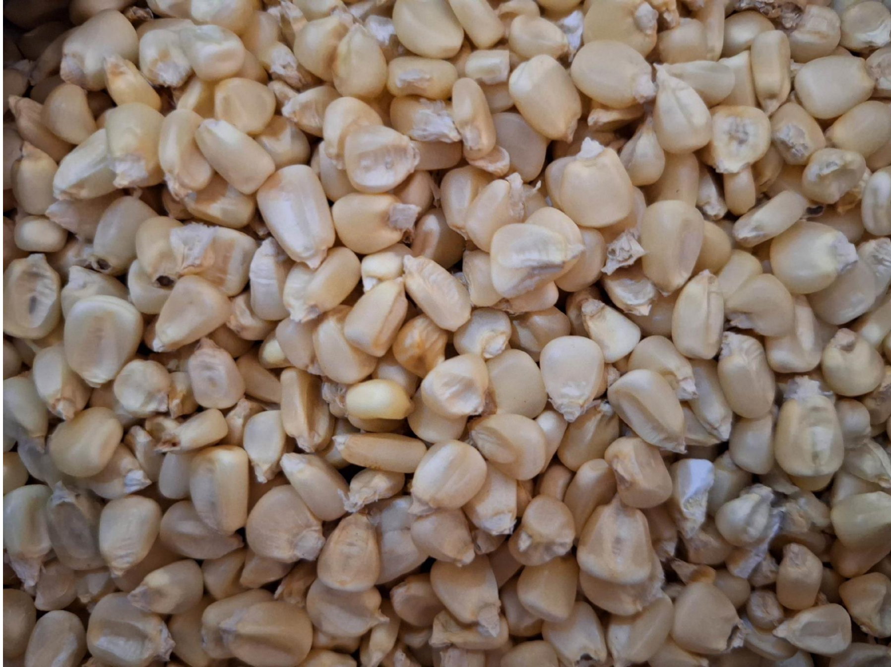
Les graines de maïs