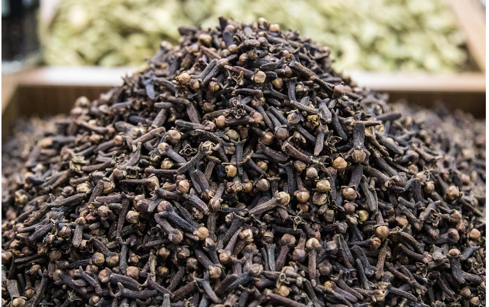
Cloves – Origin Comoros