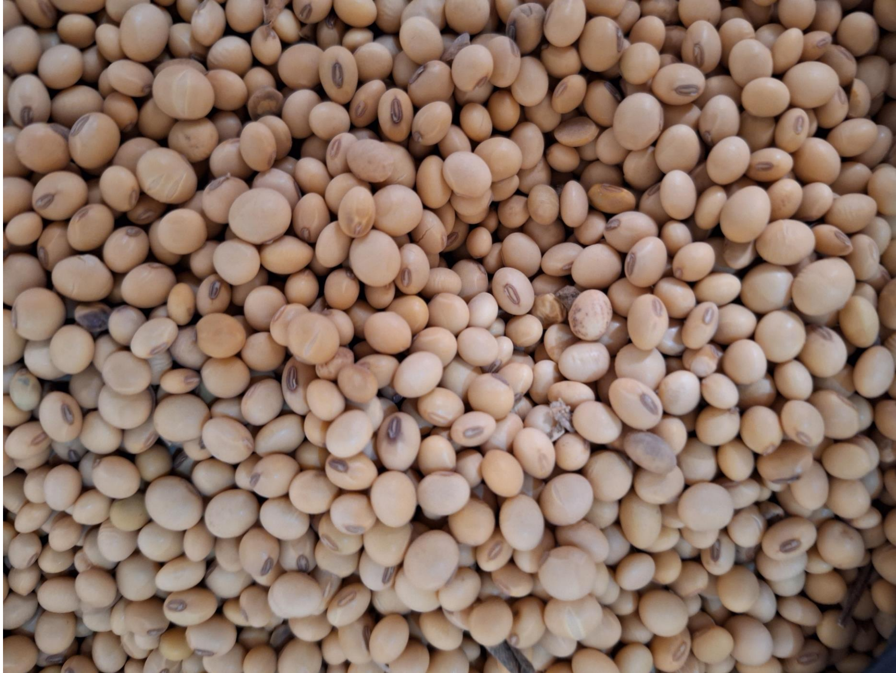
Les grains de soja