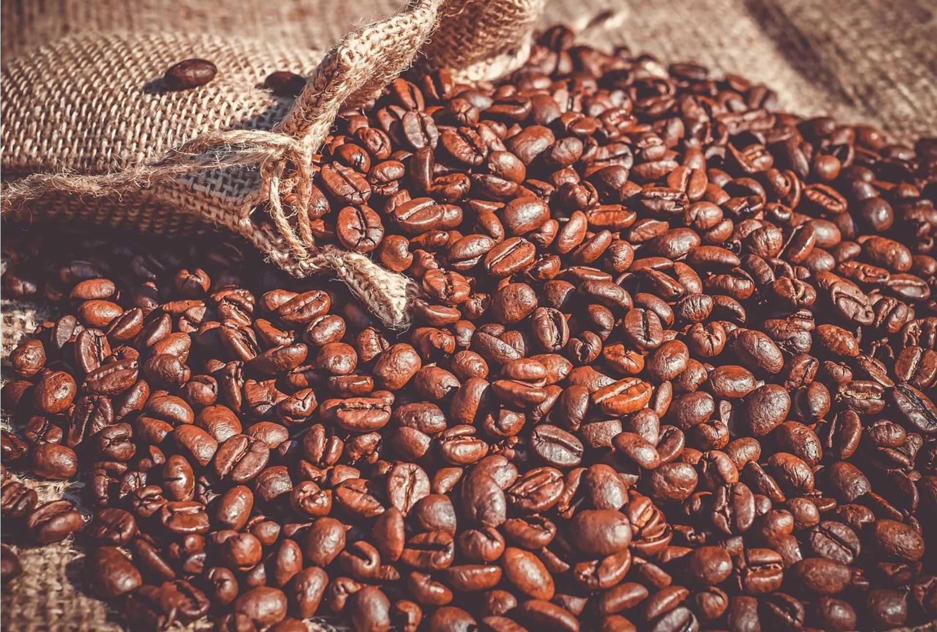
Granos de café: Robusta, Arábica, Variedades locales